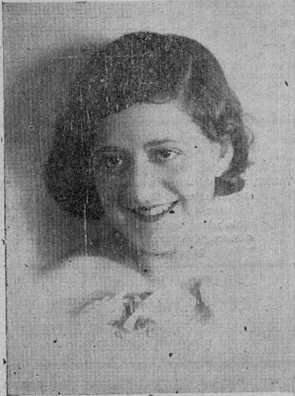
S. M. ISABEL I.

Atentos siempre a informar acerca de los acontecimientos sociales de mayor resonancia, "A. B. C." honra su primera página con las fotografías de las encantadoras damitas de nuestro mundo social, que concurrirán al café danzante que el San José Athletic Club ofrecerá mañana domingo en sus salones a la sociedad capitalina.