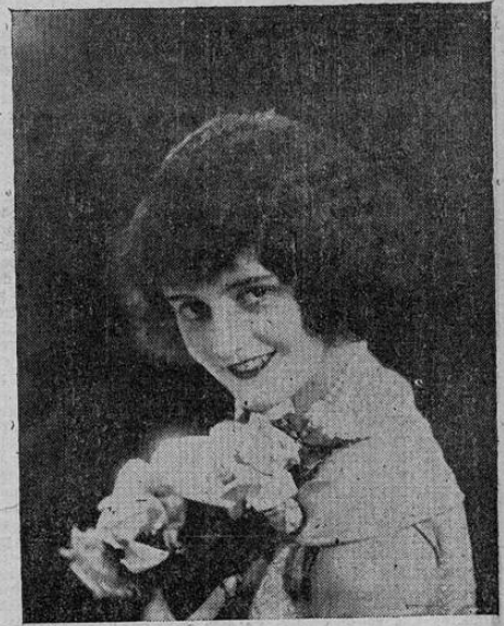
S. M. HORTENSIA II.

Para este acontecimiento social, reina un gran entusiasmo dentro de nuestros círculos sociales y no dudamos que resultará tan brillante como las que la Directiva del citado Club ofrece a menudo a la culta sociedad josefina.